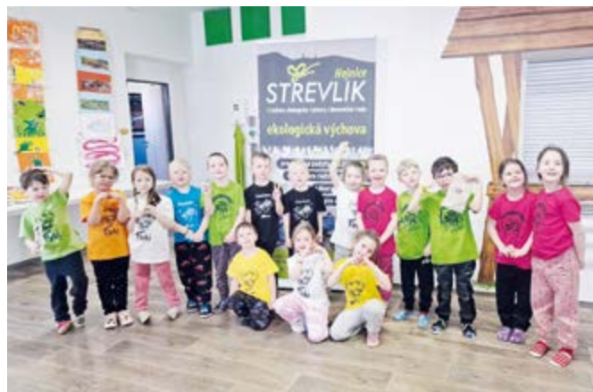
Za MŠ Eliášova Horáčkova Z.

Na závěr měsíce se šla celá školka rozloučit se zimou. Za zpěvu jarních písní a vhozením Morény do řeky Ploučnice jsme tímto zakončili zimu a přivítali jaro.