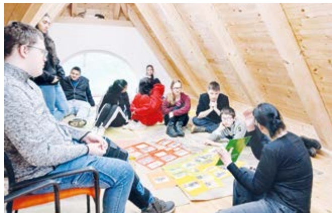
Mgr. J. Standová pokračování na další straně

V úvodu jsme v učebně zkoumali původ potravin, zemědělské plodiny potřebné k jejich výrobě a stroje, které zemědělcům pomáhají při práci. Ve skupinách jsme sledovali cestu potravin od nákupu až k jejich původu. Poté jsme si prohlédli zemědělské stroje a dozvěděli se více o jejich využití při práci na polích. Po závěrečném shrnutí a zodpovězení dotazů jsme se rozloučili. Děkujeme pořadatelům za organizaci akce.